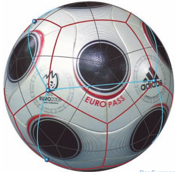
Der Europass zur EM 2008 mit Symmetrien

Verhältnis der Radien von Umkugel zu Inkugel minimiert der klassische Fußball allerdings die Anzahl der Kanten pro Ecke (3) sowie die Anzahl der Lederflecken (32) und der Nähte (90). In gewisser Hinsicht ist der klassische Fußball damit optimal. Die Bälle der Weltmeisterschaft 2006 (Teamgeist) und Europameisterschaft 2008 (Europass) zeigen trotz ihrer Unterschiede erhebliche Ähnlichkeiten zum klassischen Fußball: Zur Verdeutlichung wurden in Rot die Kanten eines Dodekaeders aufgemalt. In Blau sehen wir einen Würfel, dessen Seiten jeweils einem Flansch sowie jeweils zwei Dodekaederseiten zugeordnet sind.